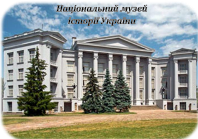
Національний музей історії України