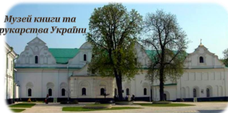
Музей книги та друкарства України